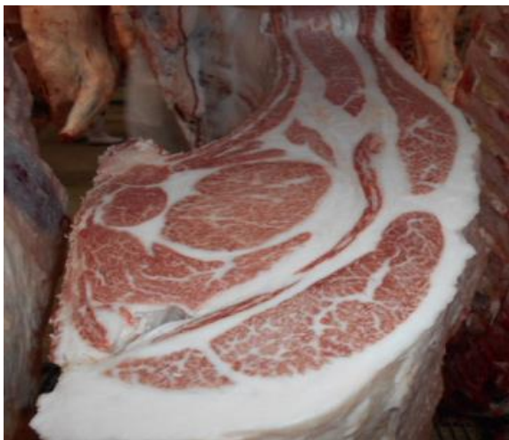
「京都食肉市場 特選牛」のロース芯断面