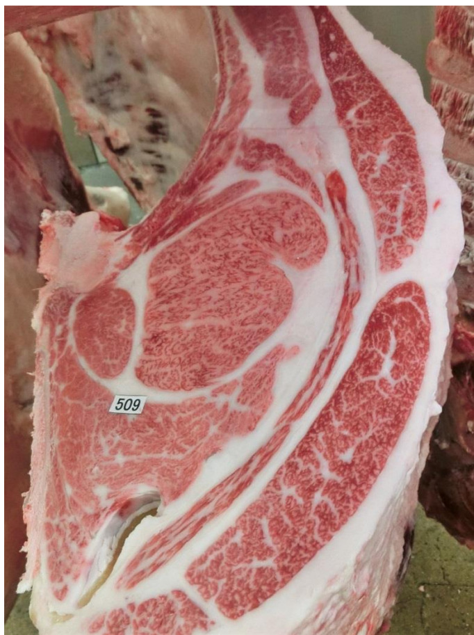
・ ロースの断面 (左写真)